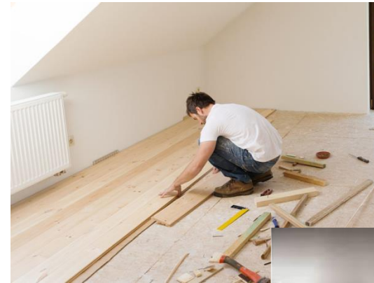
Técnico en obras de Interior, Decoración y Rehabilitación